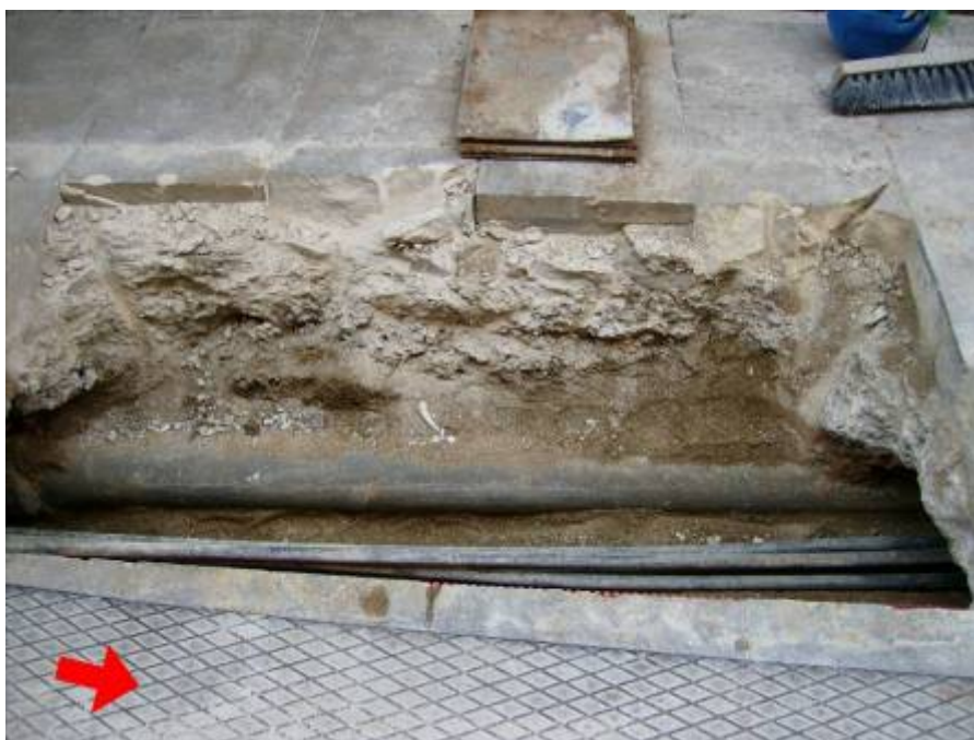
Cala 4 de la Rasa 100