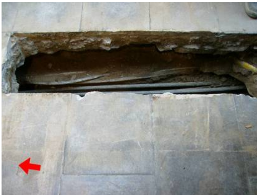
Cala 2 de la Rasa 100