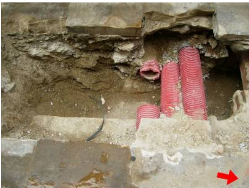
Cala 1 de la Rasa 100