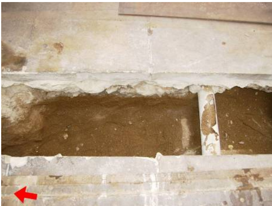
Cala 12 de la Rasa 100