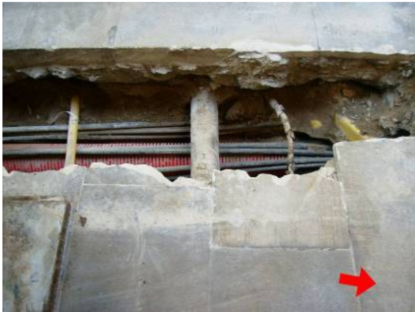
Cala 3 de la Rasa 100