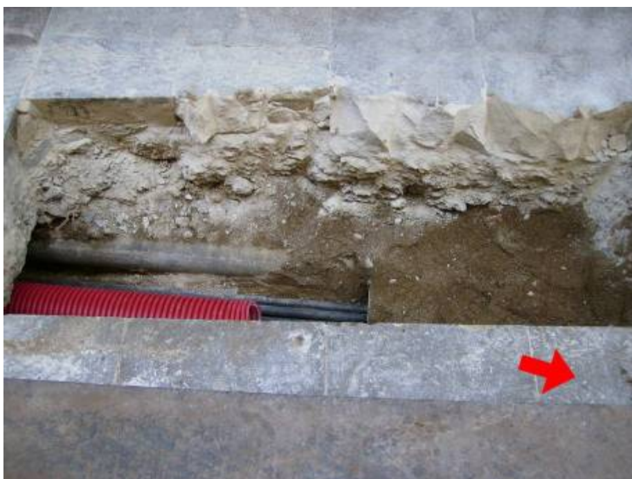
Cala 6 de la Rasa 100