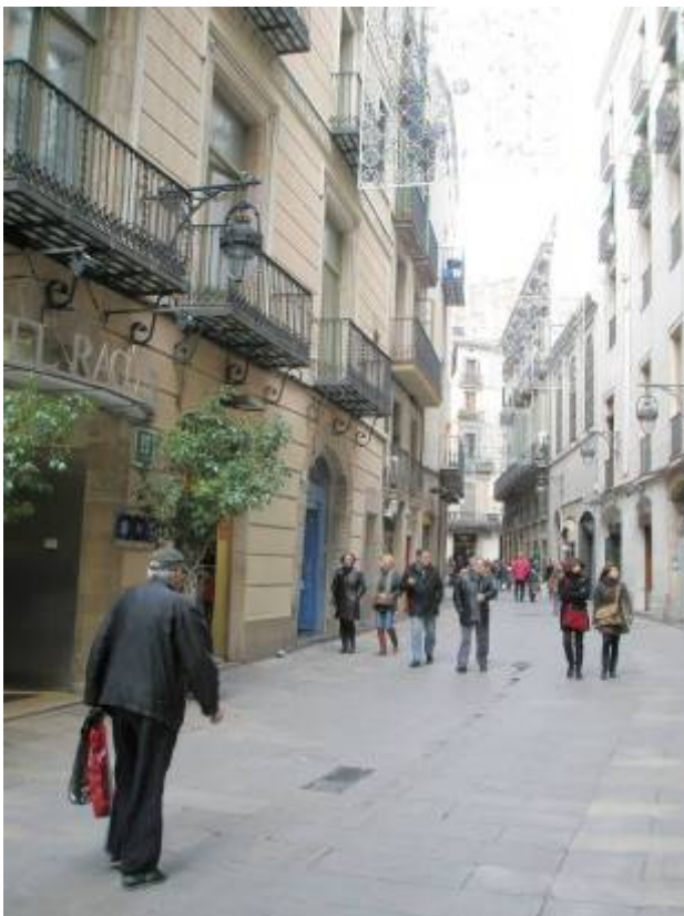
Tram del carrer del Pi on es va realitzar la Rasa 100